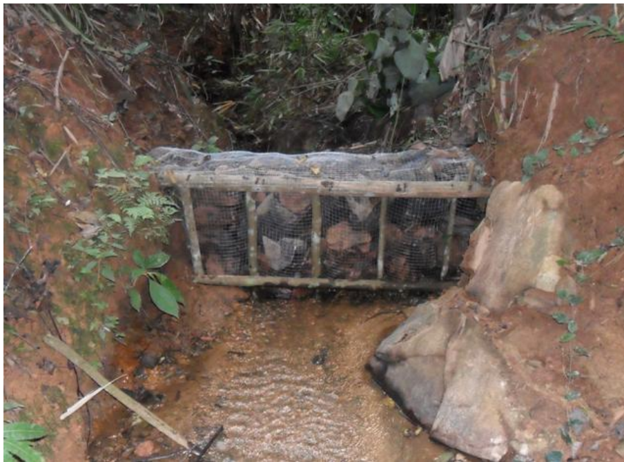
จัดทำฝายต้นน้ำแบบผสมผสาน จำนวน 120 แห่ง