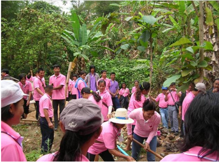
จัดฝึกอบรมงานการอนุรักษ์และฟื้นฟูระบบนิเวศป่าไม้