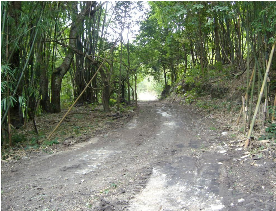
จัดทำแนวกันไฟ ระยะทาง 40 กิโลเมตร