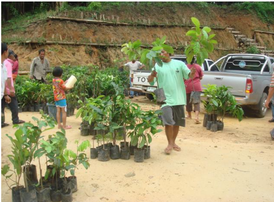
ส่งเสริมการพัฒนาอาชีพในเชิงอนุรักษ์