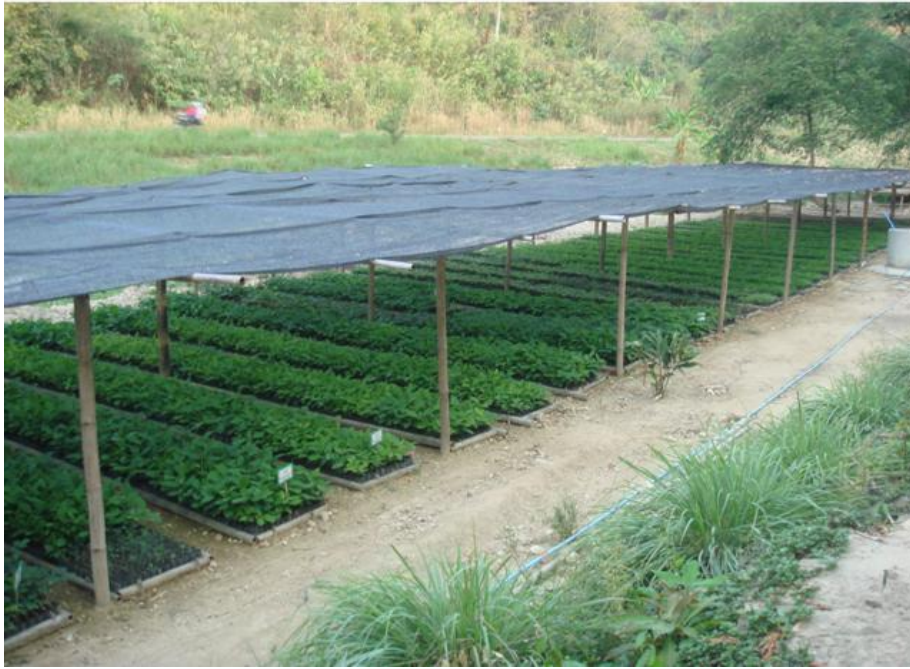
เพาะชำกล้าไม้ทั่วไป 200,000 กล้า