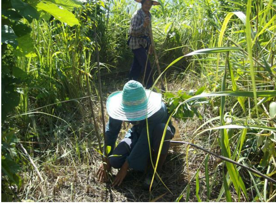
ปลูกป่า 3 อย่าง ประโยชน์ 4 อย่าง